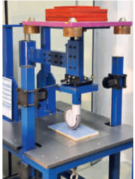
Abb. 4: Prüfstand der Testreihen [2]