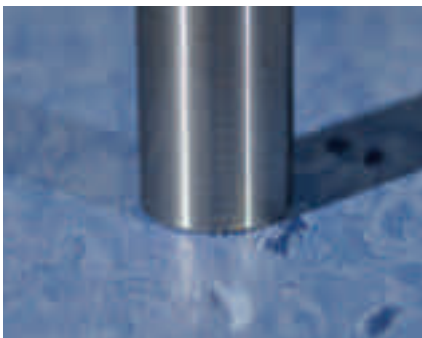
Abb. 1: Normdruckstempel, DIN EN ISO 24343 auf PVC Belag, Druckfläche 100 mm 2 [3]

Zunächst erfolgten Messungen des Resteindruckverhaltens nach DIN EN ISO 24343-1 an Bodenbelagsproben auf Stahluntergrund zur Beurteilung der Materialeigenschaften des Bodenbelages (siehe Abb. 1).