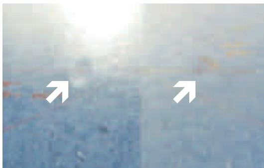
Abb. 5: Sichtbarkeit der Eindrücke nach Belastung in Abhängigkeit vom Glanzgrad [1]