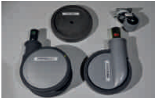
Abb. 7: Räder u. Rollen der Testreihen [2]