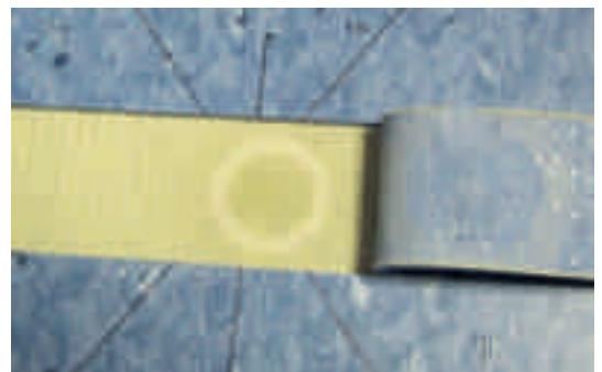
Abb. 6: Klebstoffverquetschung nach Belastung [1]

Im nächsten Schritt wurde der Einfluss unterschiedlicher Klebstoffe (Universalklebstoff für elastische Bodenbeläge sowie ein faserarmerter Nassklebstoff auf Dispersionsbasis) mit sonst gleichen Parametern untersucht.