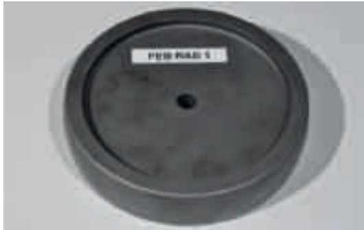
Abb. 3: Testrad aus Stahl (Referenzrad) [2]