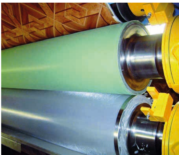
Lackierwerk, Foto: Olbrich, Converting Machinery Manufacturer

Für den Kunststoff Polyurethan besteht nach EN 1043-1 die Kurzform PUR.